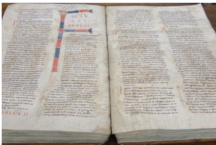
Bibbia atlantica del XI secolo

L'abbazia dispone inoltre di un ricchissimo archivio storico, nel quale si conservano i diplomi pontifici e imperiali, i documenti giuridici ed economici e le Cronache del monastero; i documenti più antichi risalgono alla fine del X secolo.